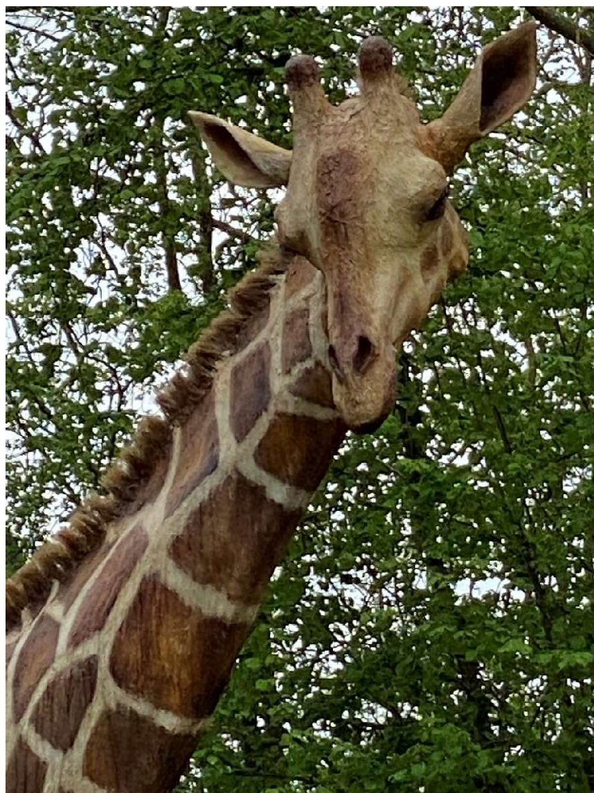
Rare jongens die Ollanders